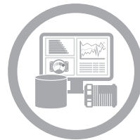
PLANT INFORMATION MANAGEMENT