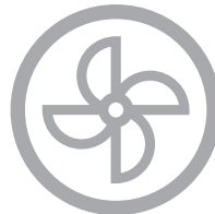
BUILDING AND AUXILIARY MANAGEMENT