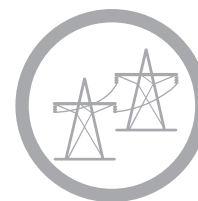
DISTRIBUTION MANAGEMENT SYSTEM